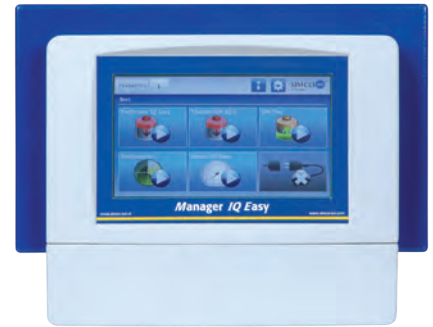
Farbiger 7" Touchscreen