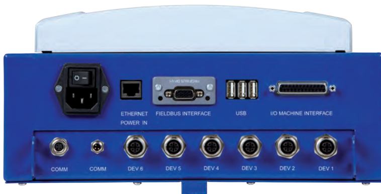
Anschluss von bis zu 6 Geräten