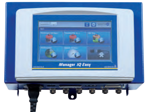
Einfache Kabel Zugang